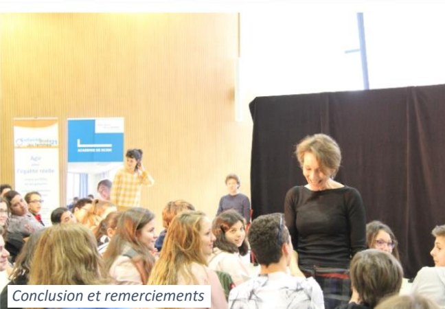
Conclusion et remerciements