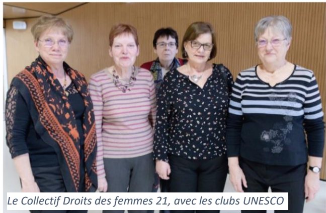
Le Collectif Droits des femmes 21, avec les clubs UNESCO