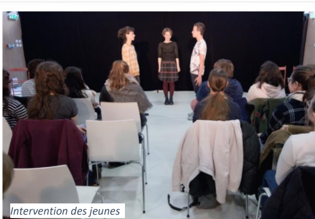
Intervention des jeunes